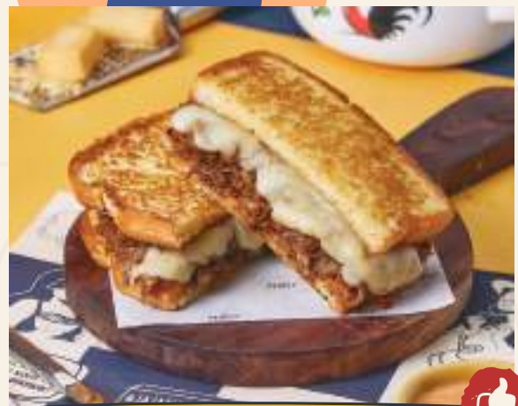
PHILLY CHEESE SANDWICH 65K

Bistik ayam goreng renyah dengan saus jamur. Disajikan dengan kentang goreng