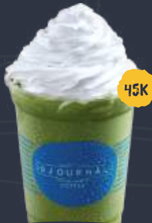
GREEN TEA FREEZE