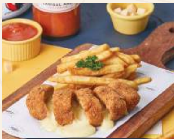
CHICKEN CORDON BLEU 65K

Sandwich keju dengan daging sapi iris tipis ala Philadelphia