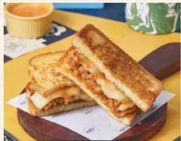
NASHVILLE CHICKEN SANDWICH 65K

Ayam goreng renyah isi keju mozzarella dan potongan daging ham. Makannya pakai kentang goreng