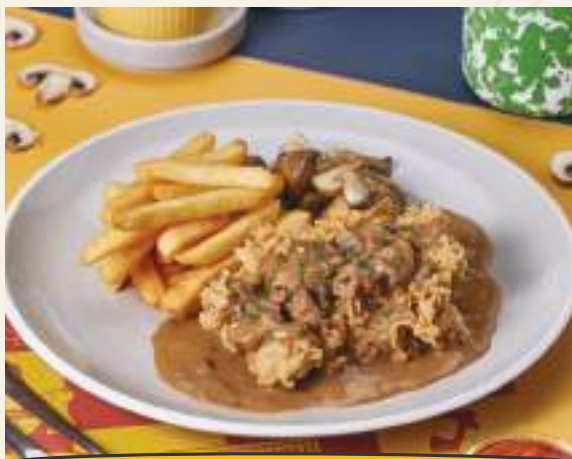
CHICKEN STEAK ALA TPC 58K

Bistik ayam goreng renyah dengan saus jamur. Disajikan dengan kentang goreng